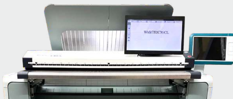
Сканер, установленный на принтер Canon