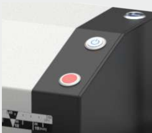
Сохранение результатов сканирования на USB-носитель

На сегодняшний день WideTEK36CL-600-MF6 является самым быстрым цветным CIS-сканером на рынке. Устройство работает со скоростью 25 см в секунду и разрешением 200 точек на дюйм в полноцветном режиме. А сканирование с полной шириной захвата 36 дюймов и разрешением 600 точек на дюйм выполняется со скоростью 4,3 см в секунду. Более того, скорость сканирования увеличивается втрое при работе в черно-белом или полутоновом режимах, однако при необходимости (например, при сканировании особо ценных и хрупких оригиналов) ее можно снизить.